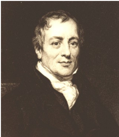
David Ricardo (Inglaterra, 1772-1823)

La pobreza resulta de obstaculizar el proceso de cooperación social.